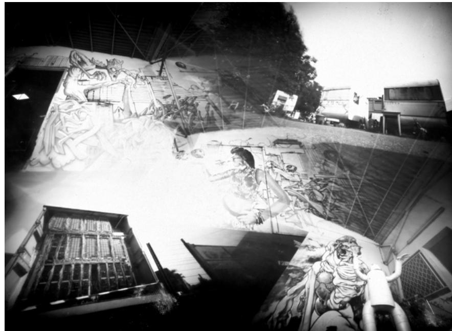
Pentatrou Myrys #2, Toulouse, 2017 • 13