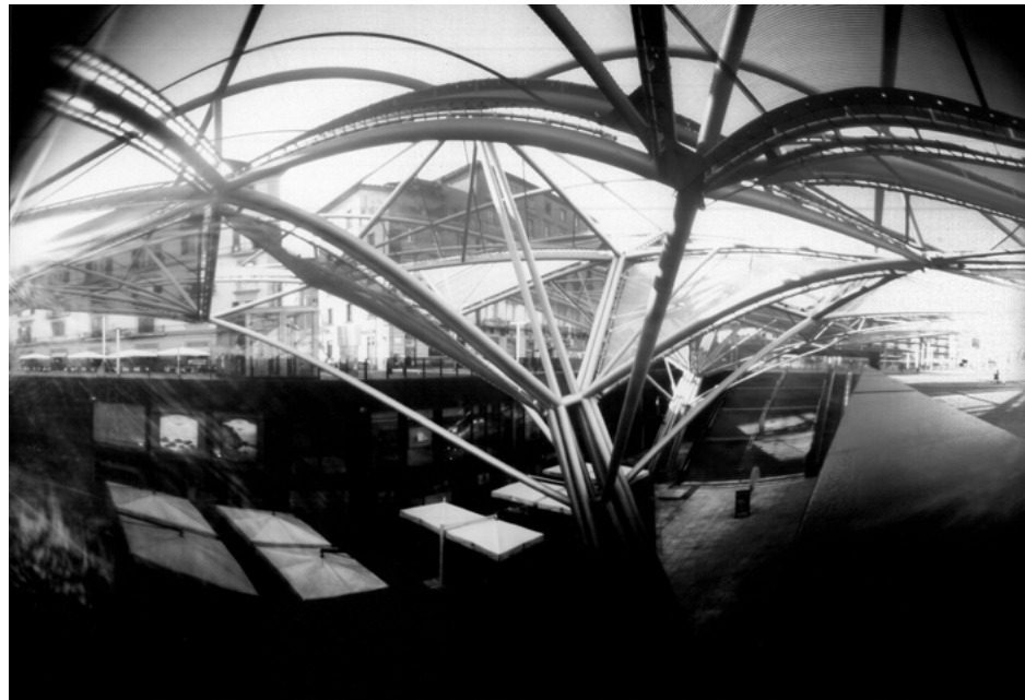
15 • Piazza Garibaldi, Napoli, 2017 • 15