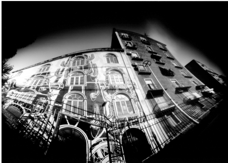
4 • Centro sociale, Napoli, 2017