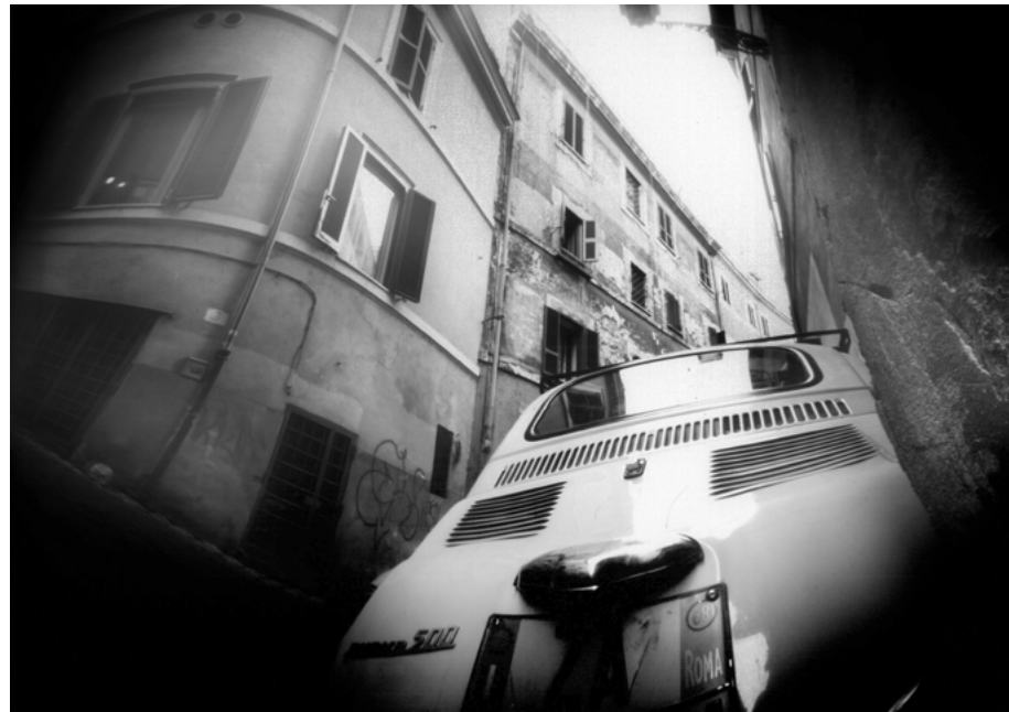
Trastevere, Roma, 2017 • 7