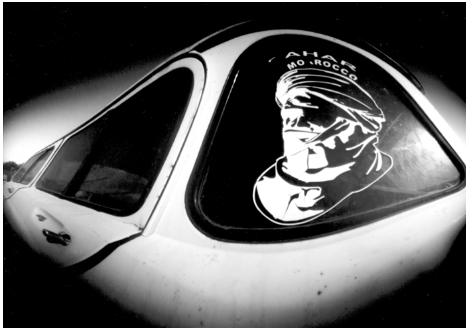
8 • 4L du désert, Maroc, 2019