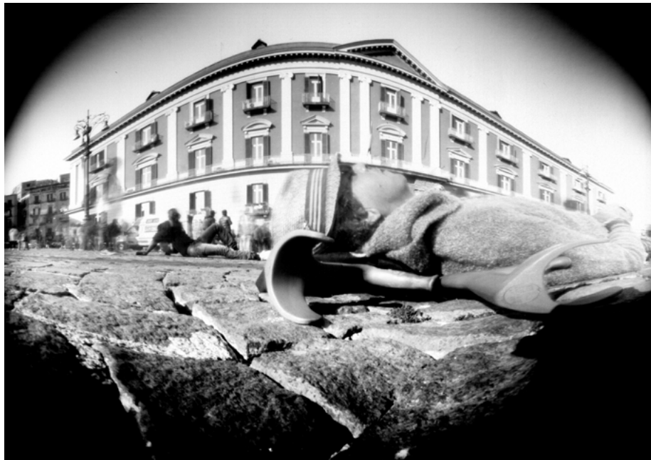
6 • Salvatore, Roma, 2017