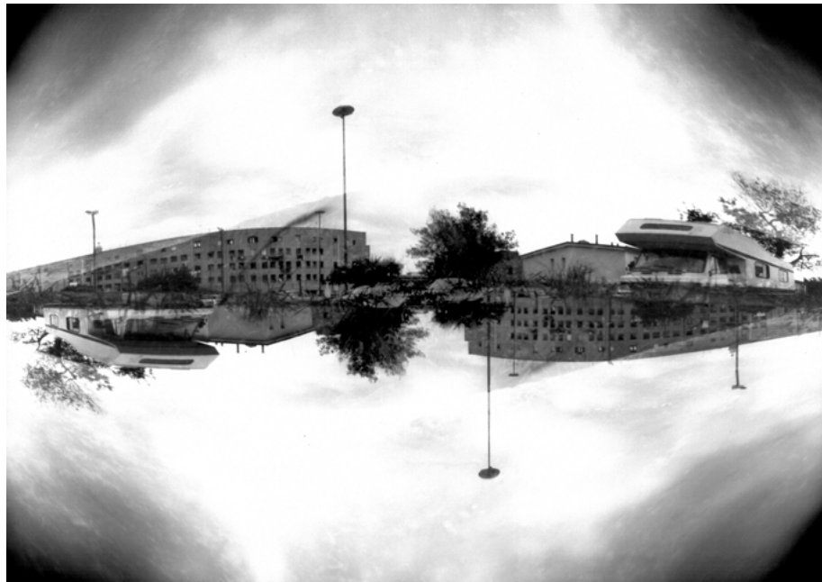
19 • Symétrie centrale, Napoli, 2017