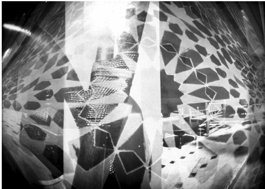
14 • Zetaoctets, Maroc, 2019