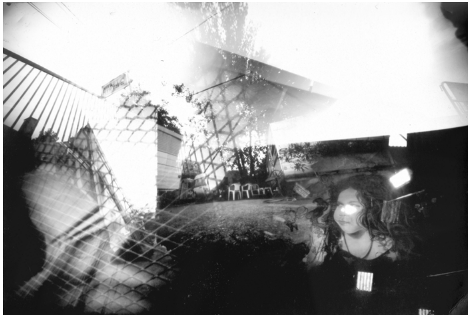
12 • Pentatrou* Myrys #1, Toulouse, 2017