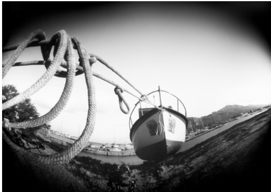
Le nœud, San Vito lo Capo, 2018 • 9