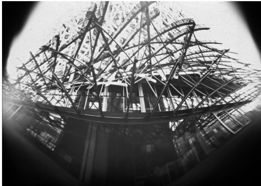
Le nid, Nantes, 2017 • 11