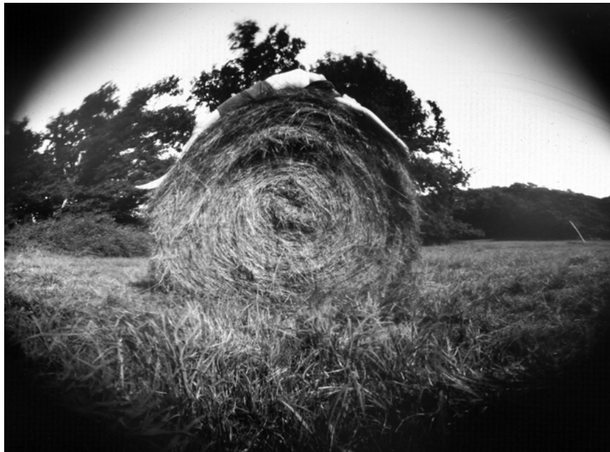
10 • Songe d'un après-midi d'été, Saint-Avit-Sénieur, 2019