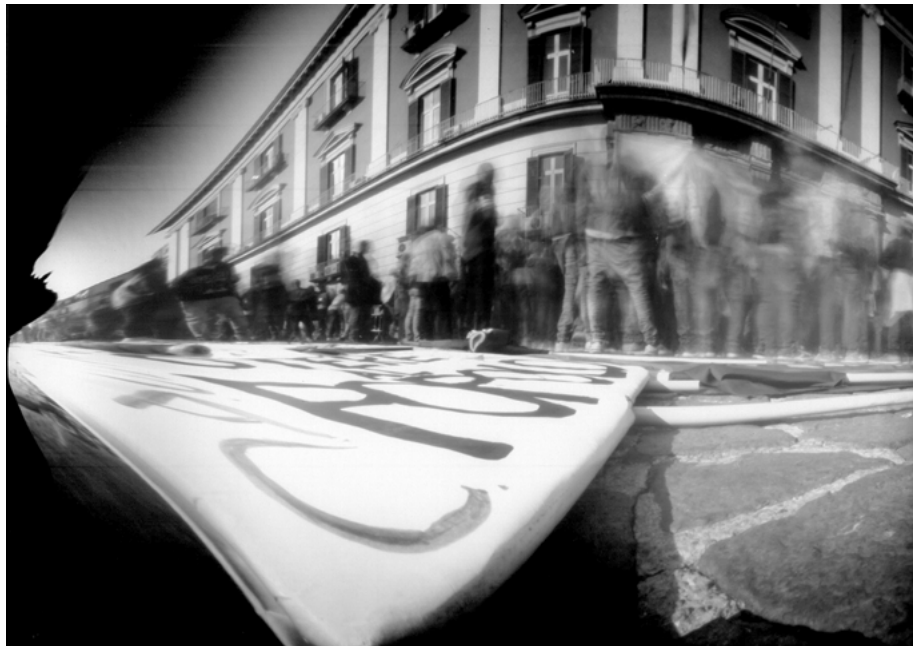
5 • Potere al popolo, Napoli, 2017