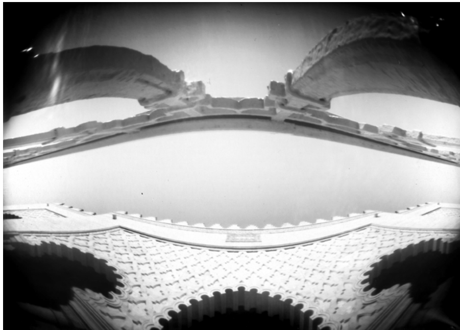
18 • Tombeau des rois, Rabat, 2017